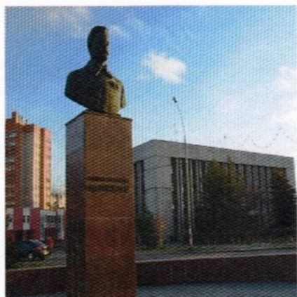
Бюст Михаила Васильевича Фрунзе - военного комиссара Ярославля

Всех, кто приезжает в Ярославль со стороны Москвы, встречает Фрунзенский район. Он ещё совсем молод, образован 21 февраля 1975 года. Ярославцы, живущие между Московским проспектом, Костромским шоссе, реками Волга и Которосль, называют себя жителями Фрунзенского района. В этом году будет отмечаться 40-й день рождения района.